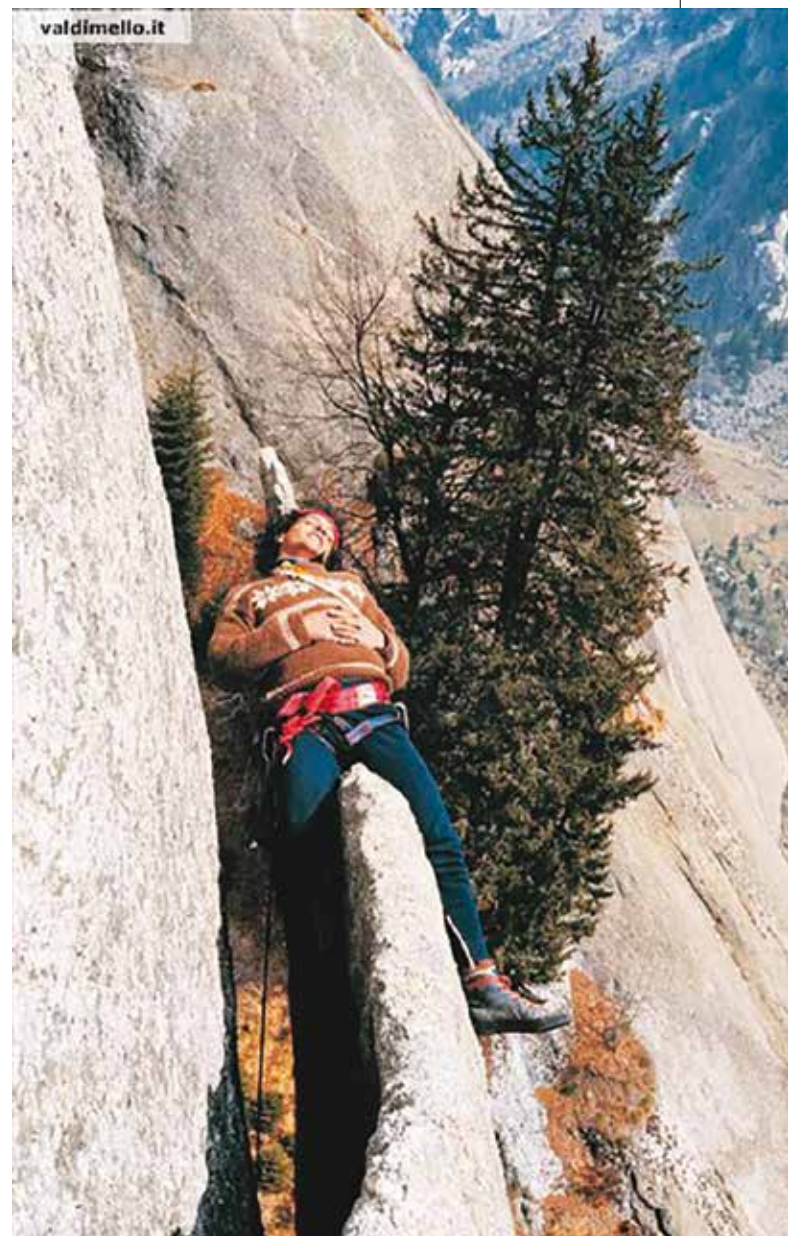
Olivo Tico sulla Porta del Cielo.

Nei confronti di Polimagò sia io sia Ivan, mio inseparabile compagno di avventure melliche, abbiamo sempre avuto un che di referenziale. Ci vuole una particolare preparazione mentale per potere affrontare quel tipo di vie. Sulla carta le grandi classiche della Val di Mello hanno circa lo stesso grado che difficilmente supera il VII; questa via è però famosa per un traverso di circa 40 metri gradato solamente V, ma totalmente sproteetto; stando a quanto si dice in rete, in realtà è la parte meno complicata della via. “Chissà il resto!” ci domandavamo. Non si può barare