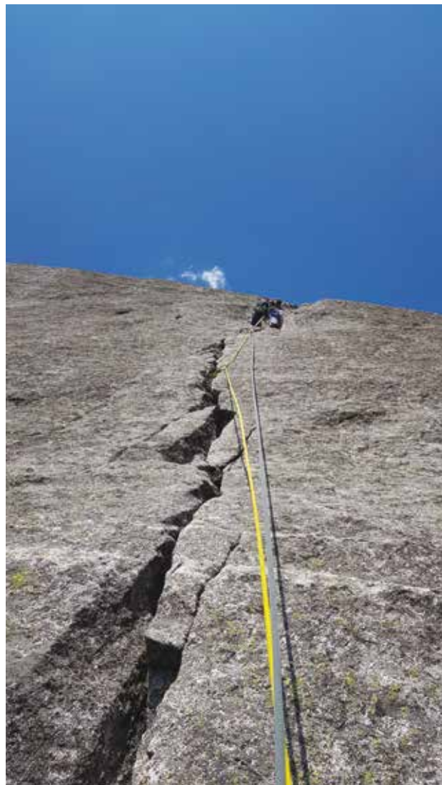
Il terzultimo tiro in comune con Luna Nascente, uno dei posti più belli delle Alpi. In immagine io che salgo.

A me in montagna, ma specialmente in Val di Mello, piace andarci in “punta di piedi”. Quando torno a casa voglio che di me non vi rimanga traccia. Voglio che nessuno possa dire che sono passato di lì. Quando arrampico voglio lasciare agli altri ripetitori che verranno la stessa identica via che io ho trovato. Solo così possiamo mantenere la nostra Valle al suo antico e attuale splendore. Il turismo cambia, sempre più persone vengono qui per una domenica di relax, di divertimento o di arrampicata e sempre più questo mondo fatato è minacciato da folli progetti che sono ispirati da