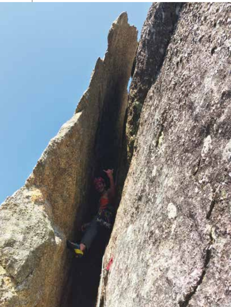
L'aggettante camino del secondo tiro. In immagine io che arrampico ad incastro.

su Polimagò, questo invece lo sapevamo bene. Non c'è possibilità di superare certi passaggi aggrappandosi ad un friend o ad un rinvio, non esiste soluzione se non nella pura arrampicata. Cadere nei passaggi chiave vuol dire farsi veramente male, se non di peggio. La via l'avevamo studiata bene, avevamo già deciso come affrontare i tiri e, poiché Polimagò ne alterna uno difficile e uno facile, avevamo concordato