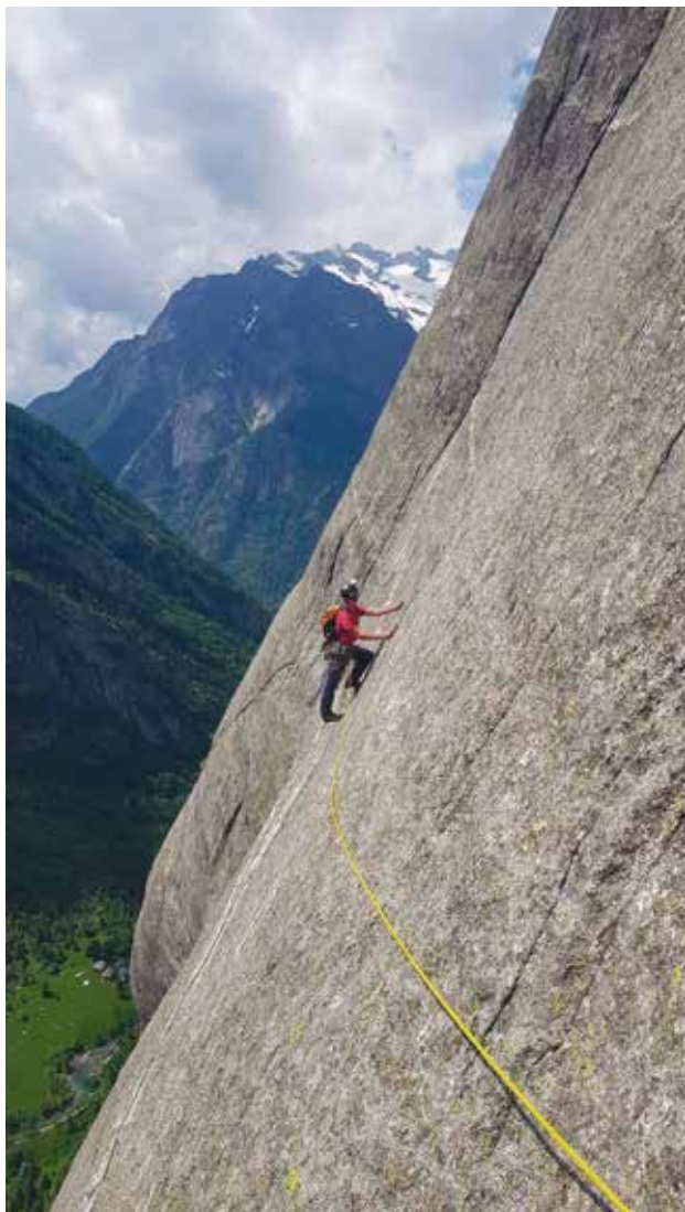
Arrampicata in aderenza lungo il celeberrimo traverso. In immagine io a una decina di metri dalla sosta.

tolto il rinvio. Qui, dove il primo affronta il tratto in discesa con la corda dall'alto e relativamente in sicurezza dal rischio pendolo letale, invece il secondo si trova la corda tirare dal basso con passi in discesa tutt'altro che banali e di non facile lettura. I metri di lasco sono al pari della situazione precedentemente descritta, circa 35. Volare avrebbe come conseguenza un pendo-